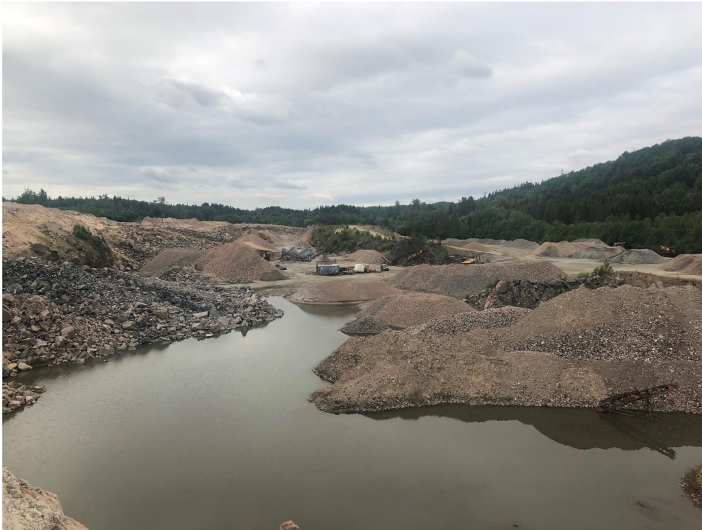
Krossverk och containers samt materialgård ses på bilden