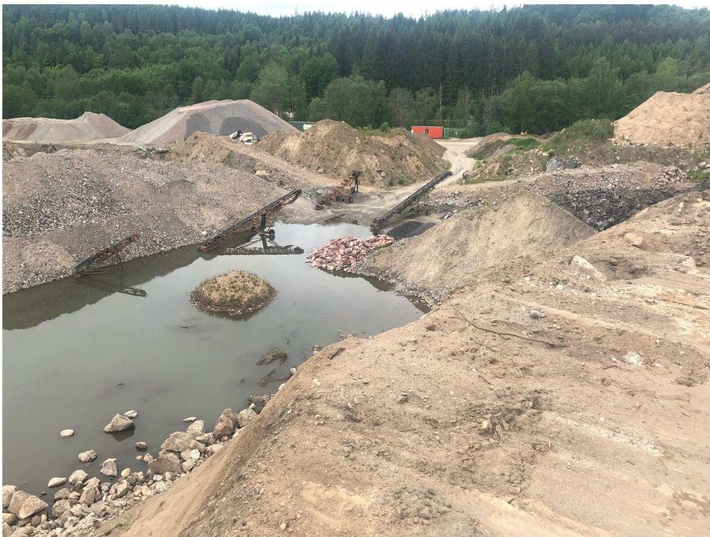
Upplag av asfalt, byggmaterial samt sten, singel och grus mv ses på bilden.